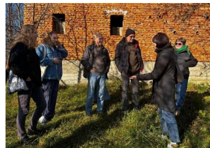
Робоча зустріч із партнерами з Fondation de France на Закарпатті, листопад 2024 р.

Зустріч в Ужгороді партнерських організацій, які за підтримки «terre des hommes Deutschland e.V.» та фінансування Федерального Міністерства закордонних справ Німеччини реалізують проєкт «Покращення захисту дітей у надзвичайних ситуаціях в Україні шляхом надання безпечних притулків, забезпечення продуктами харчування та непродовольчими товарами, а також психосоціальної підтримки»