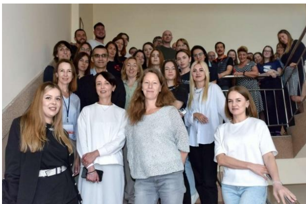
Велика партнерська зустріч Фонду Франції в Ужгороді, серпень 2023 р.