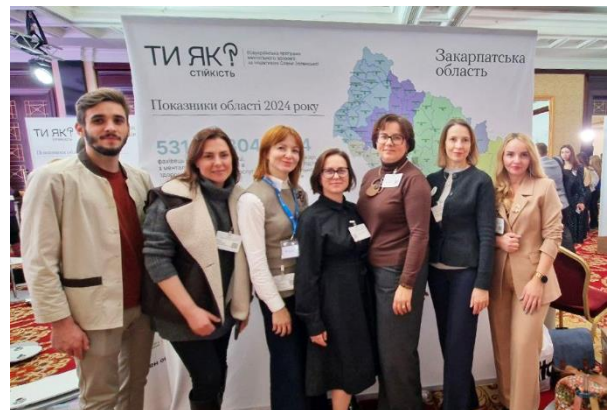
Участь у Всеукраїнському форумі ментального здоров'я, листопад 2024 р.