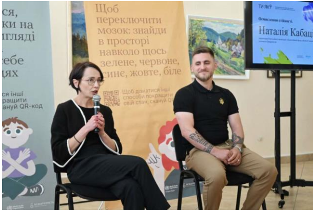
Участь у панельній дискусії «Осмишлення. Цінності та історії стійкості», травень 2024 р.