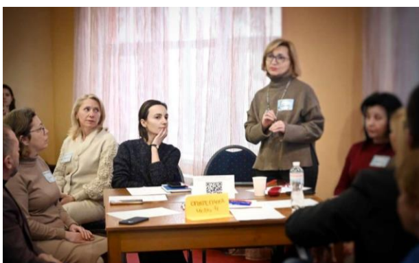
Участь у фаховому обговоренні реформи деінституалізації та розвитку сімейних форм виховання, лютий 2025 р.