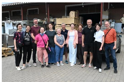
Візит команди Terre des hommes на Закарпаття, травень 2024 р.