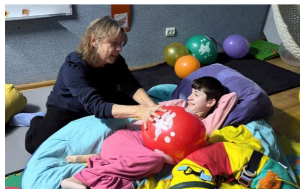
Тренінг для співробітників Вільшанського дитячого будинку-інтернату від колег зі Швейцарії, вересень 2024 р.