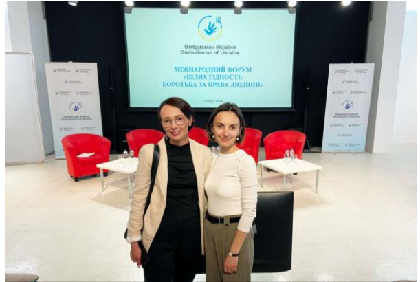
Участь у Міжнародному форумі «Шлях гідності: боротьба за права людини», червень 2024 р.