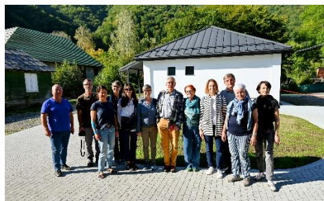
Візит президії Асоціації «Парасолька» до Закарпаття, вересень 2024 р.