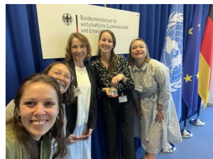
Зустріч у Федеральному Міністерстві економічного співробітництва та розвитку Німеччини, червень 2024 р.