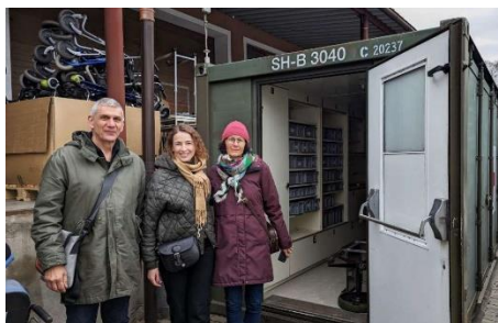
Візит на Закарпаття делегації Асоціації «Мережа «Швейцарія – Закарпаття / Україна» (NeSTU), лютий 2024 р.