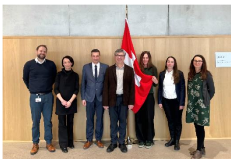
Робоча зустріч з ініціативними групами швейцарських посадовців, лютий 2025 р.

Благодійна організація «Благодійний фонд «Комітет медичної допомоги в Закарпатті» завжди готовий до діалогу заради покращення соціальної сфери, впровадження ефективних практик та апробації позитивного зарубіжного досвіду, які поліпшили б умови життя та якість послуг для вразливих груп суспільства. Організація намагається створювати майданчики для міжнародної комунікації, яка наближає стратегічне бачення партнерів до реального стану справ в Україні та оптимізує гуманітарну підтримку нашої країни. Члени команди Комітету завжди підвищують власний рівень компетентностей, що дозволяє у повній мірі досягати цілей упроваджуваних програм і проєктів.